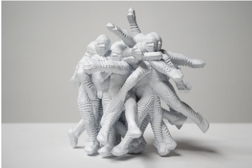
有的钟点迅如闪电, 2019, 光敏树脂3D打印, 14 1/8 x 13 7/8 x 13 7/8英寸(36 x 35 x 35 厘米), 图片版权归属奕来画廊和艺术家缪晓春, @缪晓春

398 West街, 纽约市, 纽约 10014 2019年5月25日 — 2019年7月28日 开幕式: 5月25日周六, 晚6-8时间